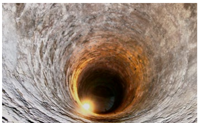
Coverfoto Neuhaus in der Wart