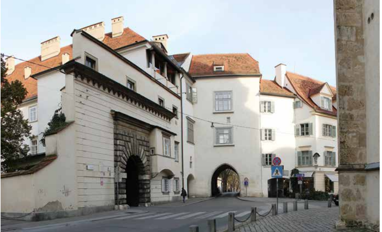
Burgtor und Burgportal / Gateway and entrance to Graz Castle