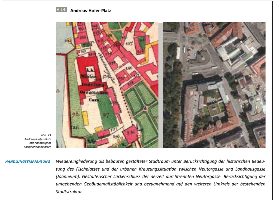
Luftbild / Aerial view Franziszeische Kataster / Land Register of Francis I

Um neuen Entwicklungen und geänderten Anforderungen an den Umgang mit der historischen Substanz Rechnung zu tragen, wurde der Managementplan mit Unterstützung vieler ExpertInnen jetzt überarbeitet, erweiterte Handlungsempfehlungen wur-