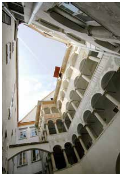
Innenhofgraffiti Hauptplatz 16 / Sgraffiti in the inner courtyard at Hauptplatz 16

Wir sind Weltkulturerbe – und jetzt? So ähnlich könnte man überspitzt die Situation beschreiben, nachdem das historische Grazer Stadtzentrum 1999 von der UNESCO zum Weltkulturerbe erklärt worden war. Tatsächlich gab es einige Unsicherheiten, wie man mit geplanten neuen Projekten in der sensiblen Zone umgehen sollte. Als dann Graz den Antrag auf Erweiterung seines Weltkulturerbes um Schloss Eggenberg stellte, gab das Welterbekomitee 2006 bei seiner Sitzung in Vilnius die Erstellung eines Managementplanes in Auftrag, der ein Jahr später einstimmig im Grazer Gemeinderat beschlossen und von der UNESCO mit Wohlwollen zur Kenntnis genommen wurde. Der Managementplan mit integriertem Masterplan bildete fortan eine mit dem Welterbekomitee abgestimmte Basis für künftige Planungsfragen im Weltkulturerbe und gab somit ein erhöhtes Maß an Planungssicherheit für alle Beteiligten.