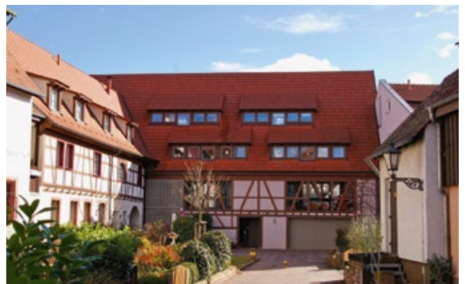
Coverfoto Palais Attems © Ledl ISG, Fotocredits siehe jeweiligen Artikel